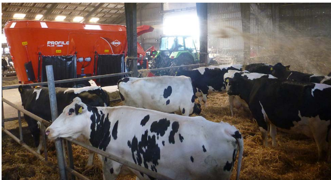
KUHNs nye fuldfoderblander med integreret halmblæser strøer her halm hos Ny Østerholm I/S i Tinglev.

For at klæde salgskonsulenterne hos MI forhandlerne på, har KUHN i dette forår holdt produkttræning i hele Europa under navnet KUHN Efficient Feeding Tour. Karavanen har også været forbi Nordjylland i maj måned. Her var salgskonsulenter fra hele landet på den praktiske skolebænk, så de er klar til at rådgive og betjene kunderne bedst muligt i valg af fuldfodervogne og strømaskiner.