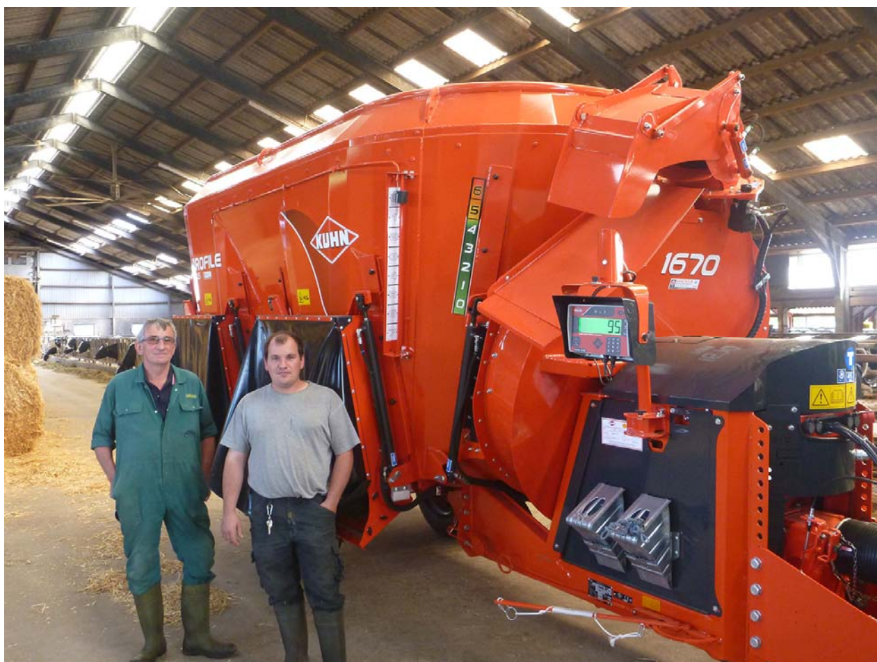
KUHNs nye fuldfoderblander med integreret halmblæser hedder Profile Plus. Det første eksemplar er slutsolgt til Ny Østerholm I/S i Tinglev (foto).