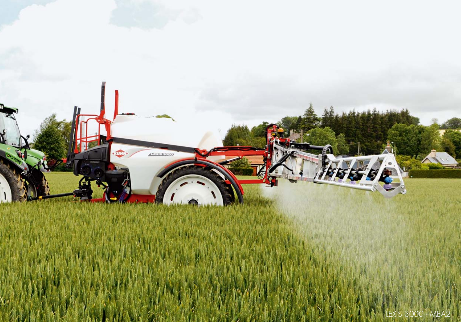
LEXIS 3000 - MEA2