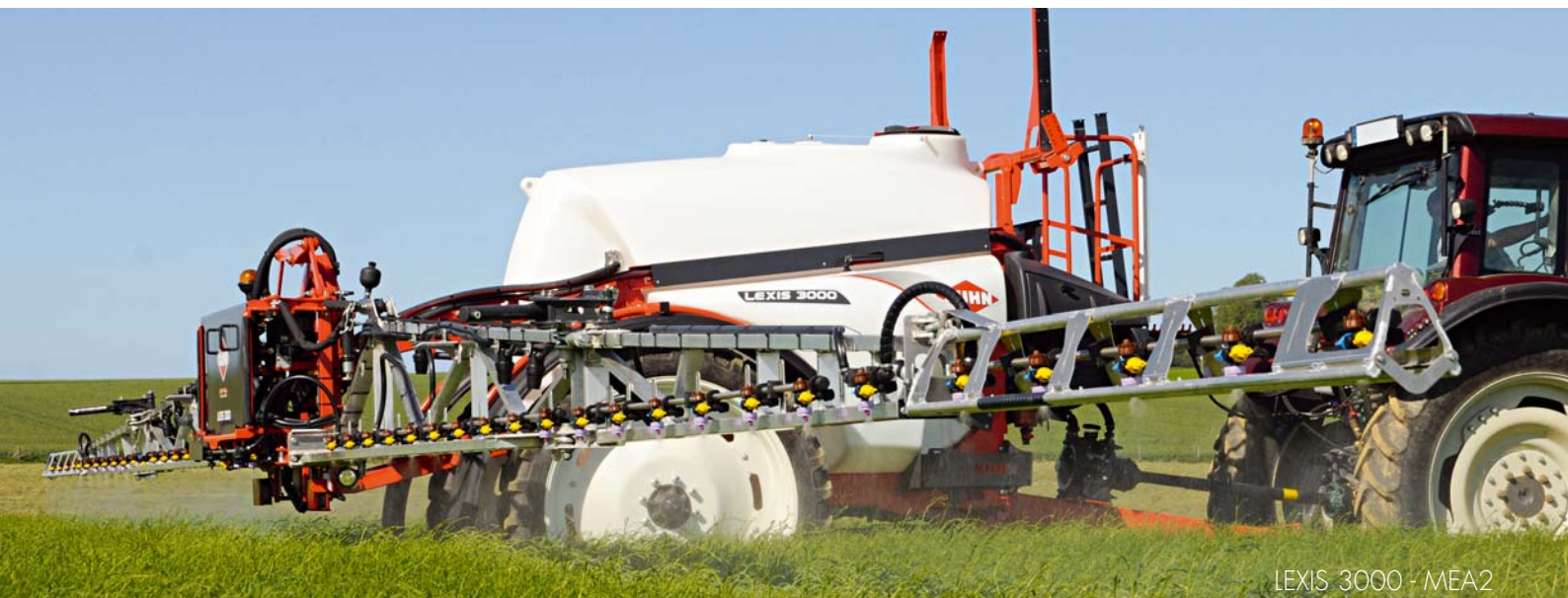
LEXIS 3000 - MEA2

Dyserne er beskyttet i bommen forfra og især nedefra samt i alle tre retninger ved påkørselssikringen. Dette giver perfekt beskyttelse af dyserne og dyserørene som standard.