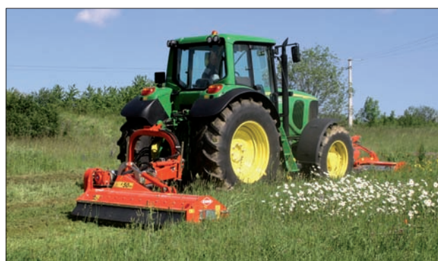
TB mulchmaskine i kombination med en frontmonteret BPR mulchmaskine

For landene i EU gælder, at vores maskiner opfylder de opstillede EU-maskinretningslinier; i andre lande vil vore maskiner blive udstyret med de påkrævede beskyttelsesanordninger i henhold til gældende retningslinier. Af hensyn til klar afbildning af maskinerne er beskyttelsesanordningerne i nogle tilfælde fjernet. Beskyttelsesanordningerne skal ellers altid være påmonterede og anbragt i korrekt position som angivet i brugervejledningens sikkerhedsforskrifter. Maskinerne leveres med det sikkerhedsudstyr, der er påkrævet i de respektive lande. Illustrationer, fotos, angivelse af tekniske data og vægt er omtrentlige og uforbindende. Forbehold for ændringer. Registrerede varemærker.