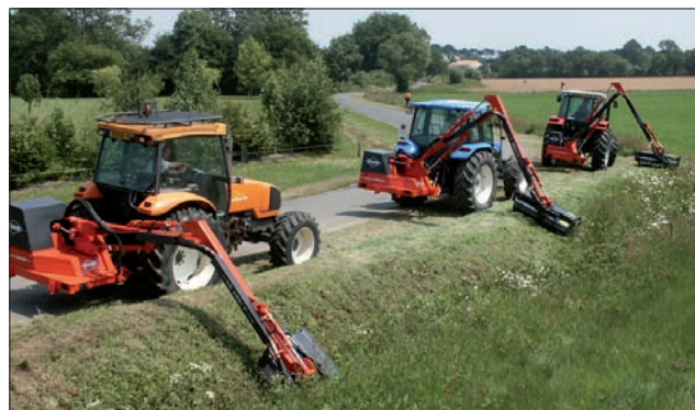
Hegns- og rabatklippere