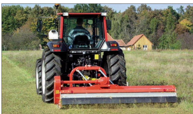
VKM universale mulchmaskiner