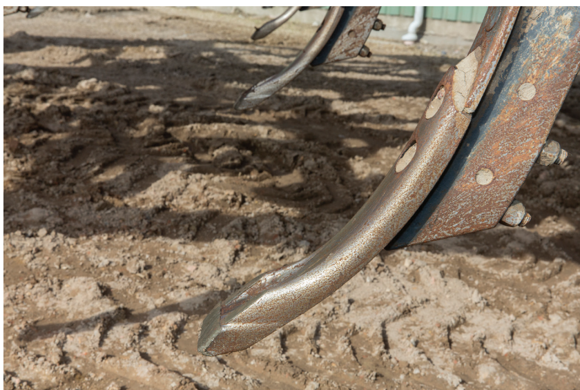
Spidserne er meget slidstærke og har en rigtig god jordsøgning.

Nu venter han kun på, at det bliver forår på den stive jord, så forårsarbejdet kan gå i gang.