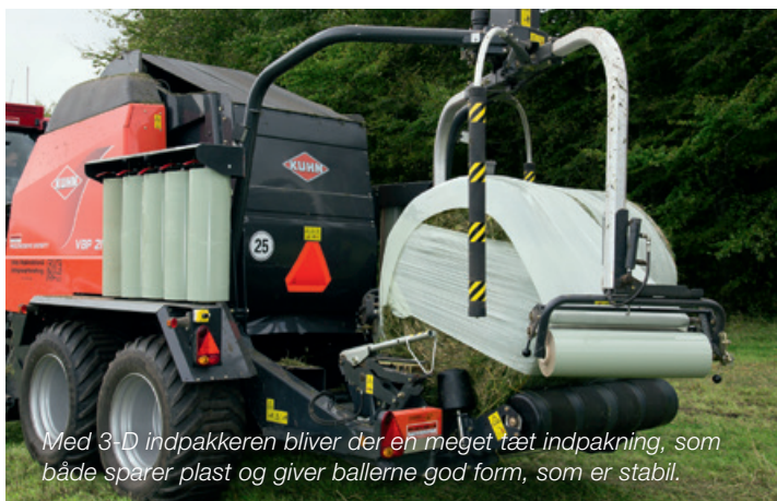
Med 3-D indpakkeren bliver der en meget tæt indpakning, som både sparer plast og giver ballerne god form, som er stabil.

Staby Maskinstation & Entreprenørforretning ApS har brug for høj kapacitet, og det har de fået med græsudstyr fra KUHN